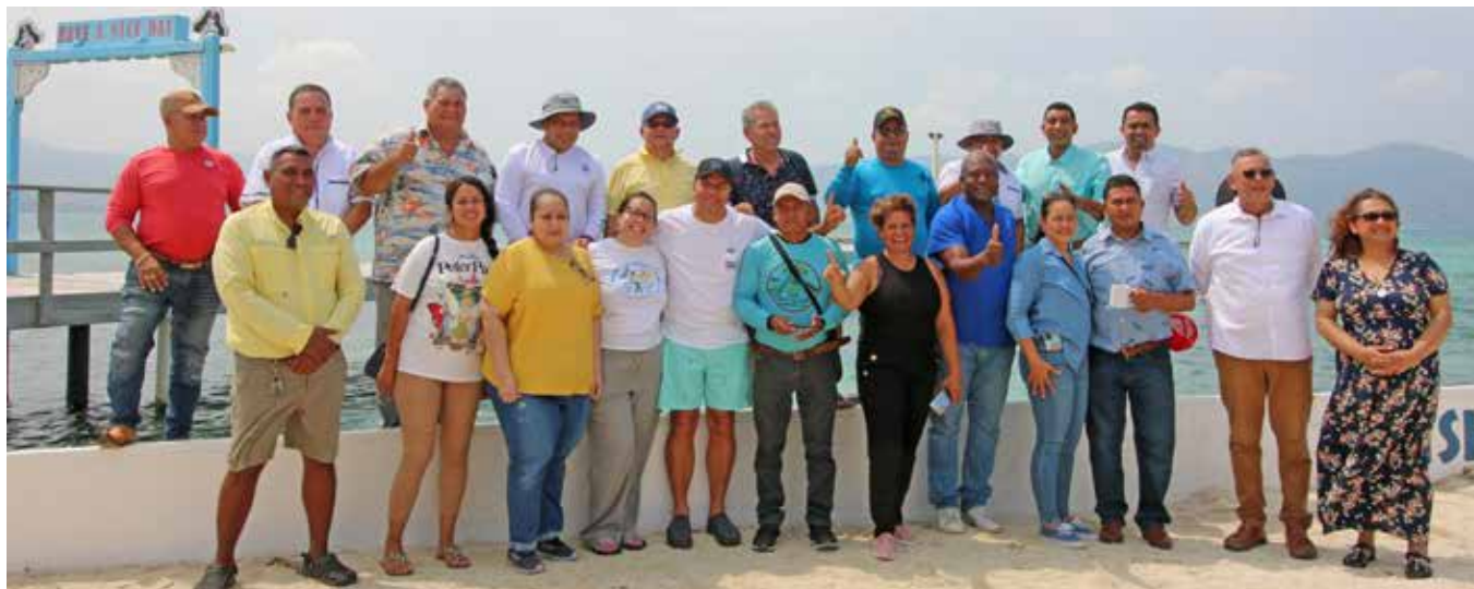
La primera reunión regional de Coastal 500 en el arrecife Mesoamericano se llevó a cabo en Guanaja, Honduras, en mayo de 2023. Los miembros representantes de más de 20 municipios de Honduras y Guatemala se reunieron durante dos días en la isla para intercambiar experiencias, discutir los desafíos que enfrentan sus comunidades y explorar soluciones para preservar y proteger su línea costera y las comunidades que dependen de ella.